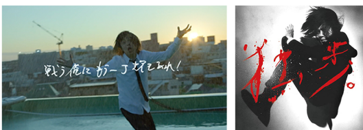
宮本浩次-ハレルヤ Music Video VFX・EDIT担当