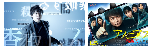
ドラマ「アノニマス〜警視庁”指殺人”対策室〜」オープニング 演出・編集・VFX