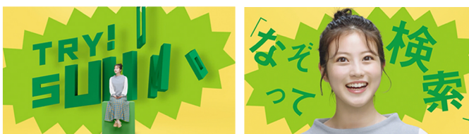
SUUMO WEB CM VFX・EDIT担当