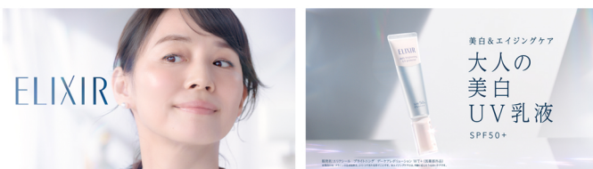
資生堂 ELIXIR 演出・編集・アニメーション