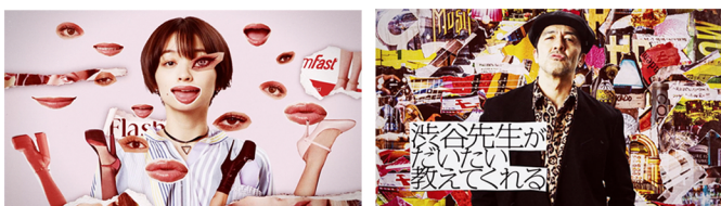
ドラマ「渋谷先生がだいたい教えてくれる」オープニング 演出・アニメーション