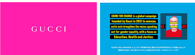
GUCCI CHIME FOR CHANGE TOKYO TOWER 演出・編集・アニメーション